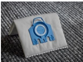
Foto 1: Eine Weltneuheit bei Miele: Mit 80 Prozent** Rezyklatanteil ist der HyClean Pure der umweltfreundlichste Staubsaugerbeutel, den das Unternehmen je hatte.