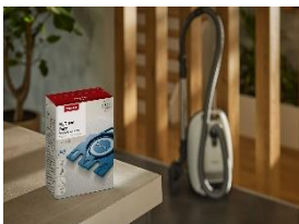
Foto 2: Optimiertes Design: Die Verpackung der HyClean Pure Staubsaugerbeutel von Miele besteht aus 100 Prozent Altpapier.