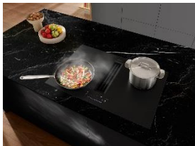
Foto 2: Das Induktionskochfeld mit integriertem Dunstabzug TwoInOne (KMDA 7876 FL) mit MattFinish ist edel in Haptik und Optik und dabei widerstandsfähig gegenüber Kratzern. Ein weiteres Plus der strukturierten Oberfläche mit Anti-Fingerprint-Effekt ist, dass kaum noch Fingerabdrücke zu sehen sind. On Top in der 125 Gala Edition: eine kostenfreie Garantieverlängerung um 125 Wochen. (Foto: Miele)

Foto 1: Zum 125-jährigen Jubiläum präsentiert Miele die grifflose ArtLine-Serie sowie Induktionskochfelder und eine Dunstabzugshaube im edlen Farbton Obsidianschwarz matt. Zusätzlich zur regulären Miele Garantie ist eine kostenfreie Garantieverlängerung von 125 Wochen möglich. (Foto: Miele)