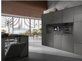
Foto 1: Zum 125-jährigen Jubiläum präsentiert Miele die grifflose ArtLine-Serie sowie Induktionskochfelder und eine Dunstabzugshaube im edlen Farbton Obsidianschwarz matt. Zusätzlich zur regulären Miele Garantie ist eine kostenfreie Garantieverlängerung von 125 Wochen möglich.